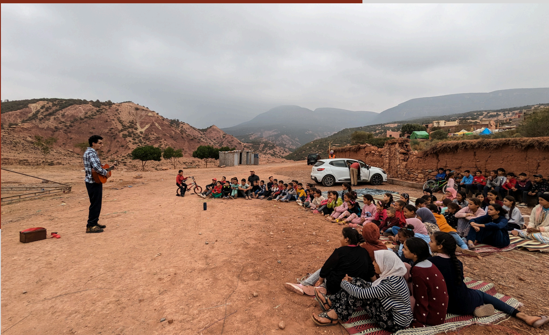
ACTION SOCIO-CULTURELLE: LE 28 OCTOBRE 2023 AU VILLAGE D'ASSELDA, UNE RÉGION TOUCHÉE PAR LE SÉISME D'AL HAOUZ (MAROC)

Lumières : En intérieur ou en extérieur nuit : prévoir si possible 1 régisseur lumière pour assurer la conduite lumière du spectacle. Public légèrement éclairé.