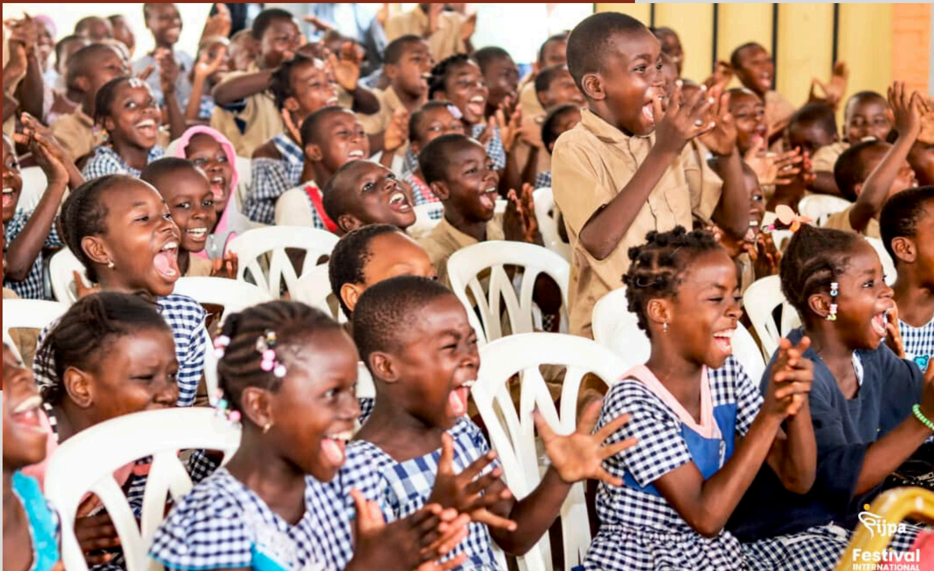
FESTIVAL INTERNATIONAL DU JEUNE PUBLIC D'ABIDJAN 2023 (CÔTE D'IVOIRE)